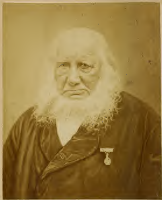
Portrait of [Name]